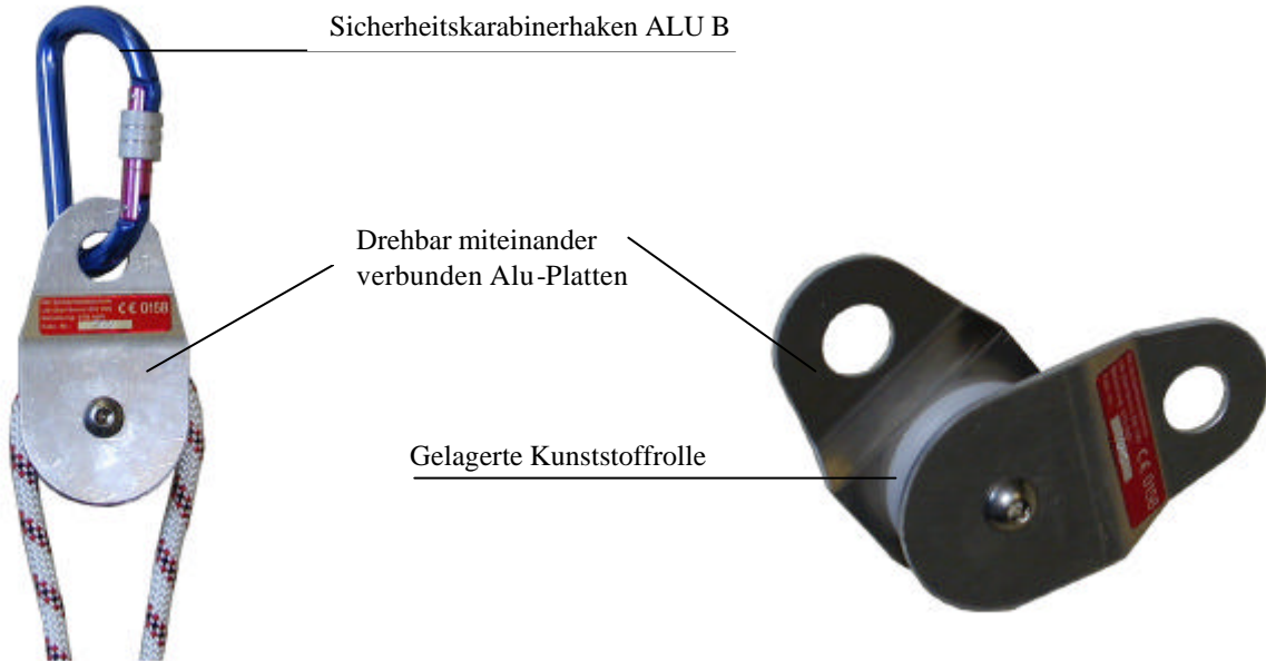
Abb.1: geschlossene U9 mit eingelegtem Seil und Sicherheitskarabinerhaken